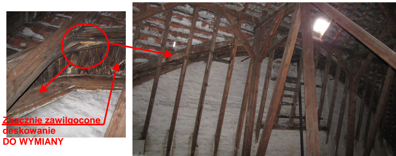
Fot. 7 Belki konstrukcji tuku znacznie zawilgocone i porażone przez owady – całkowicie do wymiany