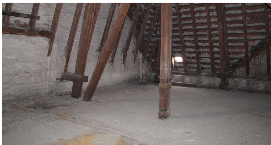
Fot. 2 Podłoga – deski drewniane gr. 2,5cm do wymiany