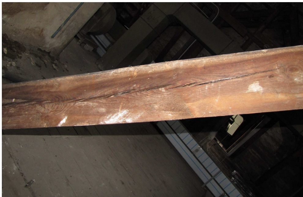
Fot. 8 Większość elementów konstrukcji więźby dachowej jest znacznie popękana