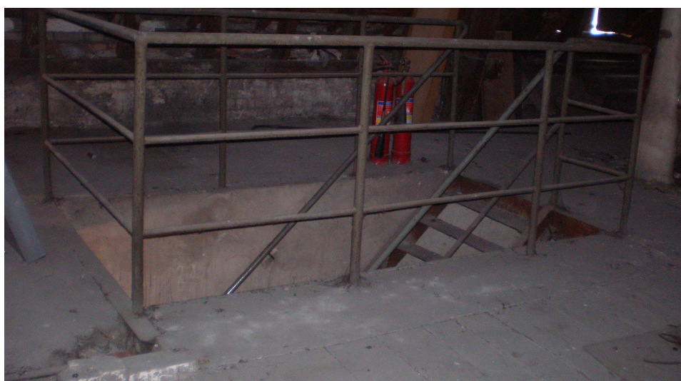
Fot. 3 Przy wejściu na poddasze znajduje się strop żelbetowy na belkach stalowych, który przemarza. Należy ocieplić